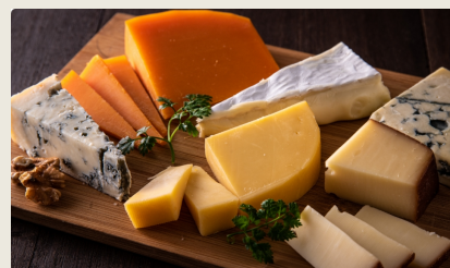
チーズ工房は町内に4つも!

今までに食べたことのないおいしさ (って言われます)。 このおいしさをず〜っと守っていくために、誰かがではなく 「みんな」で協力してまちづくりを進めています。