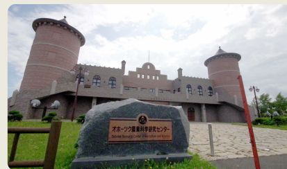
オホーツク農業科学研究センター

市街地を見下ろす小高い丘の上に、謎のお城と風車。 北海道にはここしかない、町が運営する研究施設。 自治体の職員でありながら、研究職。そんな公務員珍しい!?